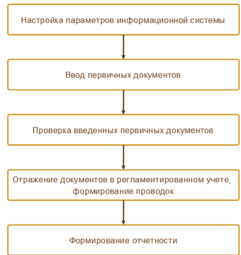
Рис. 2. Процесс настройки и ведения регламентированного учета в 1С:ERP

Работа в ERP-системе предполагает наличие регламентов действий пользователей и жесткий контроль за их соблюдением. Как и прочие пользователи, сотрудники бухгалтерской службы являются не самостоятельными единицами в принятии решений, а исполнителями действующих на предприятии регламентов. Именно такой принцип организации регламентированного учета реализован в 1С:ERP.