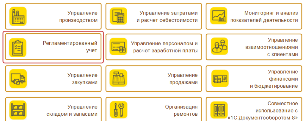
Рис. 1. Функциональные блоки ERP-системы