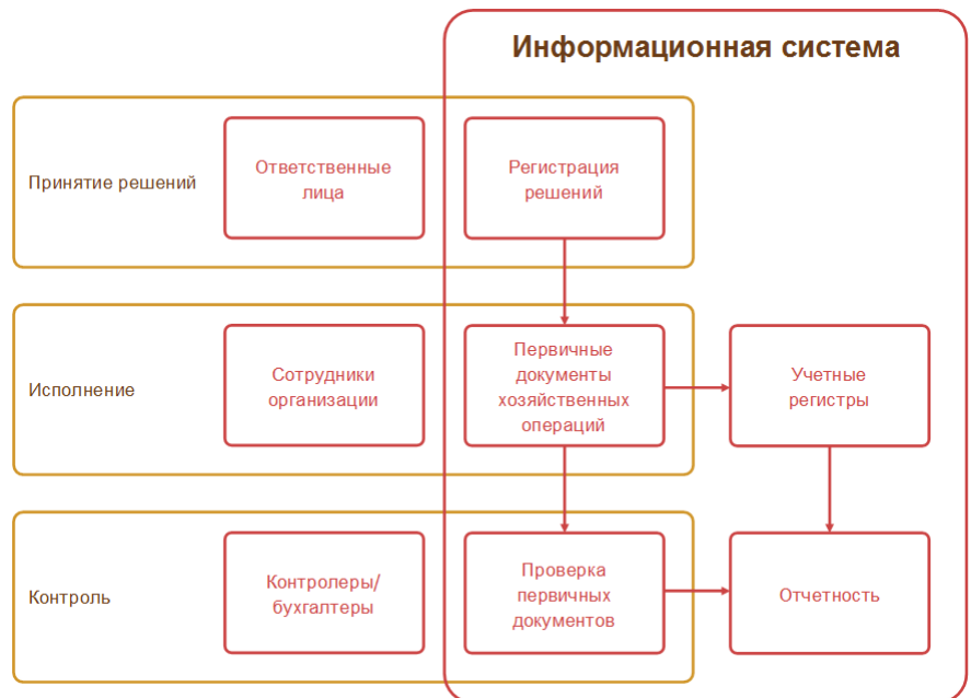
Рис. 3. Регистрация фактов хозяйственной деятельности предприятия в информационной системе

Регламентированный учет в 1С:ERP – это трактовка зарегистрированных в оперативном учете фактов хозяйственной деятельности предприятия по определенным настроенным правилам. Возможность такой трактовки обеспечивается наличием в оперативном контуре необходимых для целей регламентированного учета аналитических разрезов.